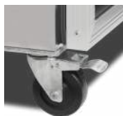
Hjul med og uden bremse